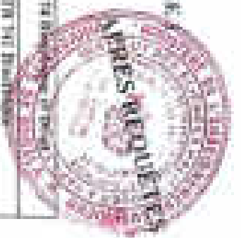
FIGURE : Department of Transformation et Contrôle des Produits Halieutiques